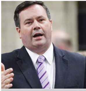
وزير الدفاع الكندي الجديد جيسون كيني

الوزير جيسون كيني بأن التفويض الذي أعطاه البرلمان الماضي للمشاركة الكندية في التحالف الدولي ينتهي في غضون شهرين ويضيف: أتوقع أن تقوم السلطات العسكرية بإطلاع الكنديين على أوضاع المهمة وأن تقوم بتقييمها وترفع توصيات بشأنها إلى رئيس الحكومة والوزراء. وموقف الحكومة صريح وهي على ثقة بأن لديها مسؤولية في أن تلعب دوراً مهماً بالتنسيق مع الحلفاء لاحتراف هذا التنظيم والحد من قدراته لأنه يشكل تهديداً كبيراً للأمن العالمي ولأمن كندا.